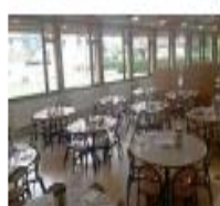
École de Toisings 462 route de Toisings 74800 Saint-Pierre-en-Faucigny École : 04 50 97 09 68 Périscolaire : 07 84 58 97 18