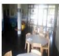
École G. Lacrose 45 rue des Grands Champs 74800 Saint-Pierre-en-Faucigny École : 04 50 25 96 00 Périscolaire : 07 84 58 94 52