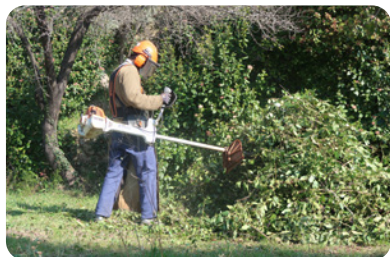
Broyage au débroussaillieur à lames de branches mises en tas et résultat obtenu