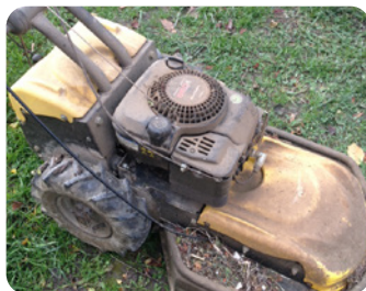
Tondeuse-débroussailluse capable de broyer des branches fines