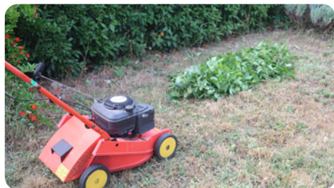
Broyage à la tondeuse d'un petit tas de déchets verts étalé