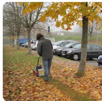
Broyage de feuilles à la tondeuse