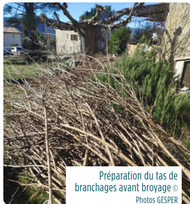
Préparation du tas de branchages avant broyage

Avant de broyer, regroupez et alignez les branches en tas.