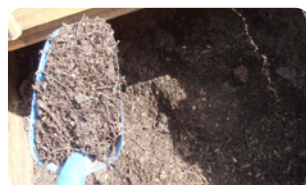
Broyat plus ou moins ligneux et/ou fin suivant les entrants et le broyeur