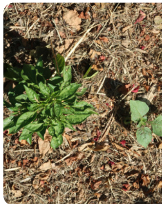
Paillis de broyat et feuilles sur basilic

→ risques de faim d'azote (Voir point 5 de cette fiche)