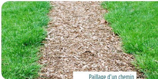
Paillage d'un chemin