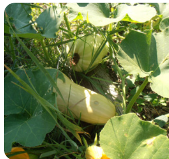
Courges cultivées sur paillage de résineux