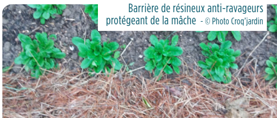
Barrière de résineux anti-ravageurs protégeant de la mâche

paillis car il y fait bon et humide. Si limaces et escargots posent problème (potager...) → éviter d'épandre des paillis verts et tendres appréciés des mollusques. On peut aussi les repousser avec des aiguilles de pin ou des brisures de coquilles d'oeufs.