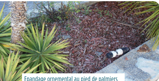
Epandage ornemental au pied de palmiers