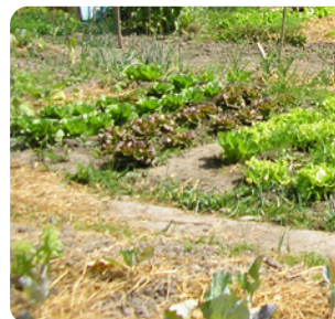
Paillage au potager

➤ En automne , sur un sol encore chaud, pour le protéger du froid de l'hiver.